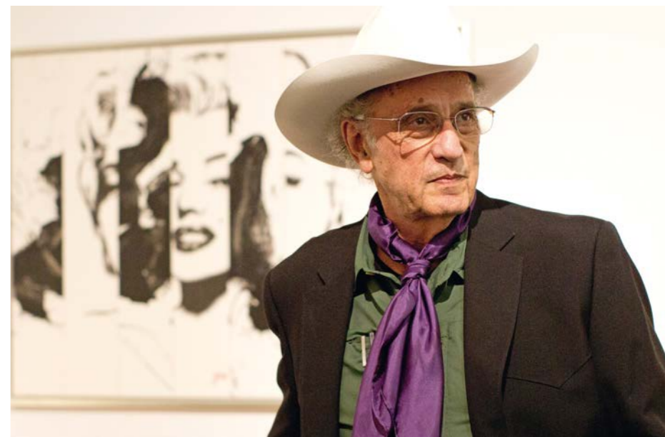
James Francis Gill – eine der letzten noch lebenden PopArt-Ikonen der Ära um Andy Warhol, Roy Lichtenstein und Edward Hopper.