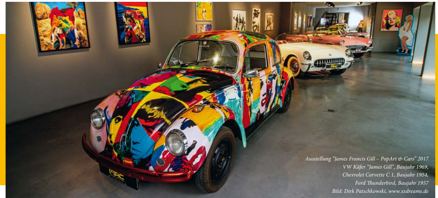
Ausstellung „James Francis Gill – PopArt & Cars“ 2017 VW Käfer „James Gill“, Baujahr 1969, Chevrolet Corvette C 1, Baujahr 1954, Ford Thunderbird, Baujahr 1957