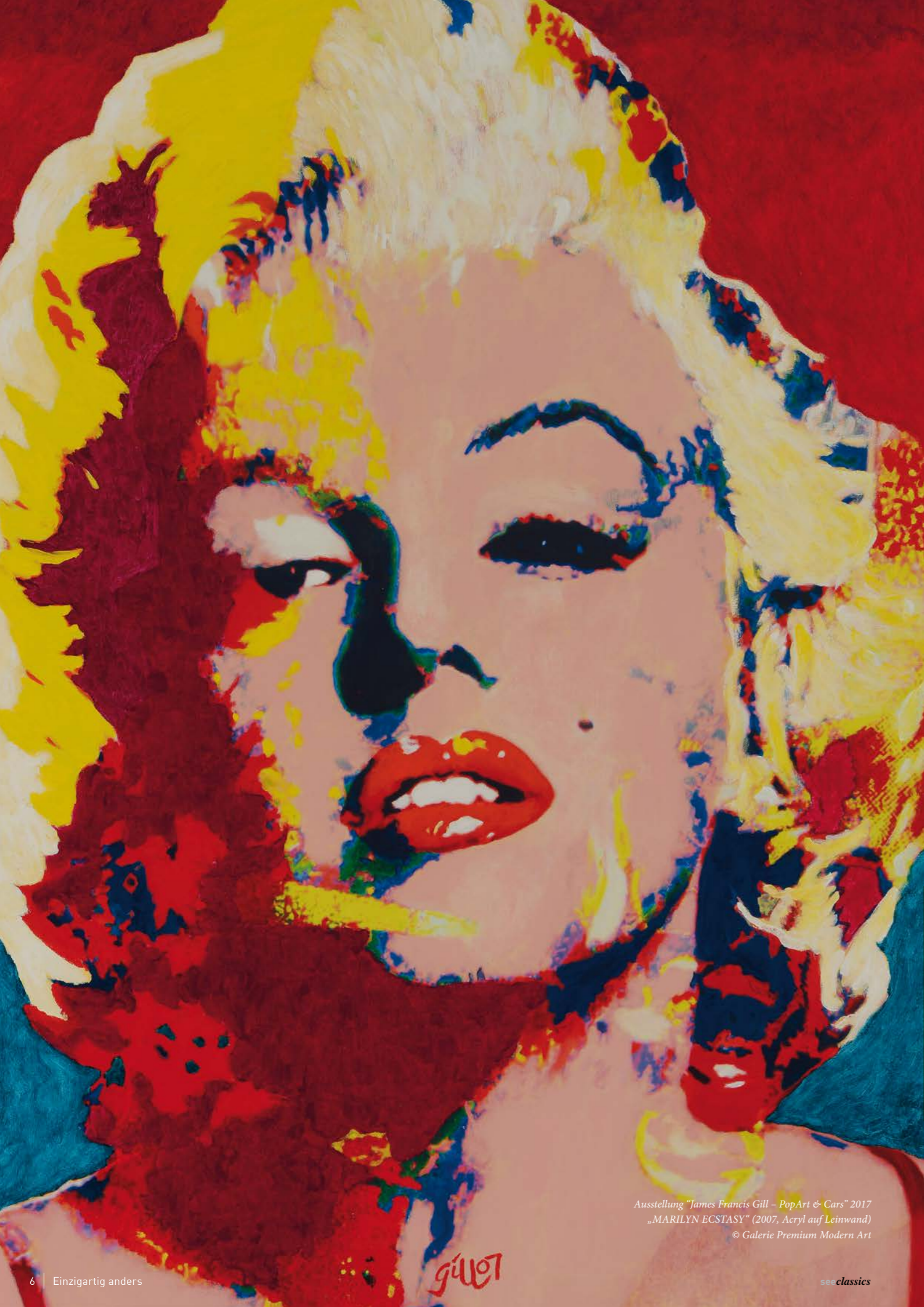
Ausstellung "James Francis Gill – PopArt & Cars" 2017 „MARILYN ECSTASY“ (2007, Acryl auf Leinwand)