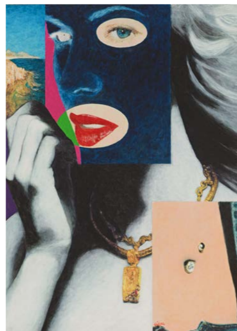
„MUSE, THE DIAMOND AND THE GOLD NECKLESS“ (2002, Acryl auf Leinwand) | © Galerie Premium Modern Art