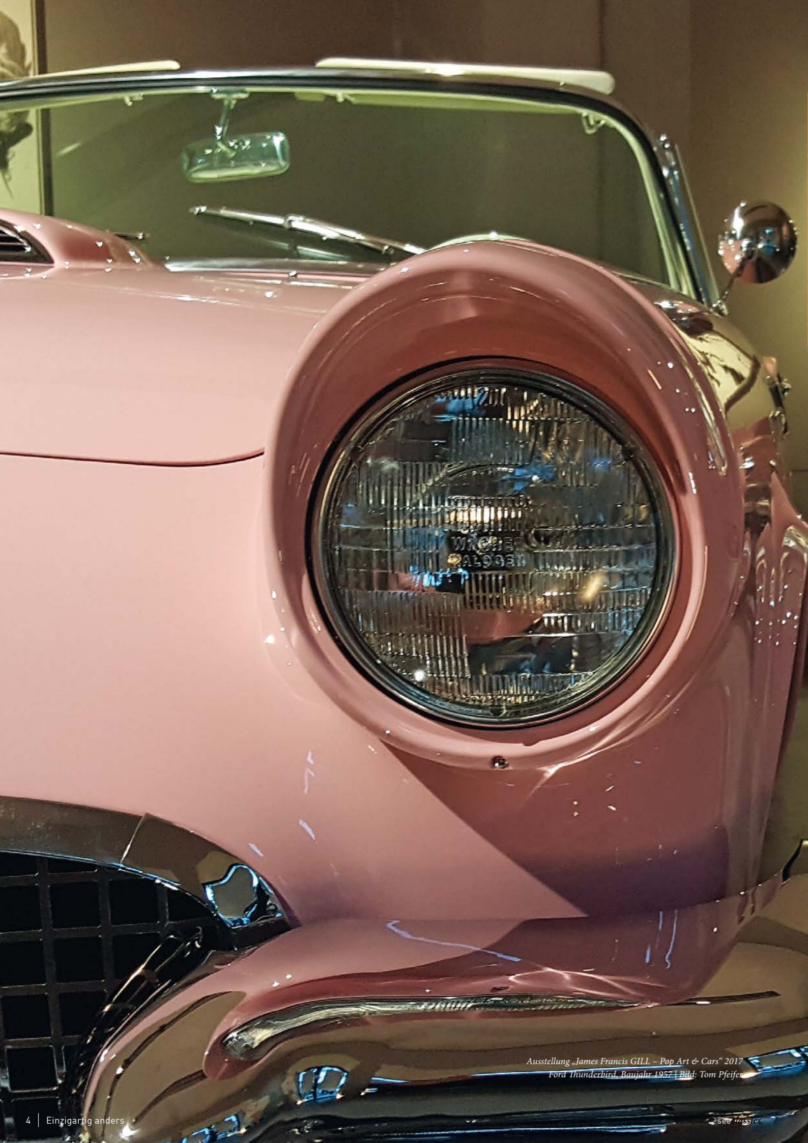
Ausstellung „James Francis GILL – Pop Art & Cars“ 2017 Ford Thunderbird, Baujahr 1957