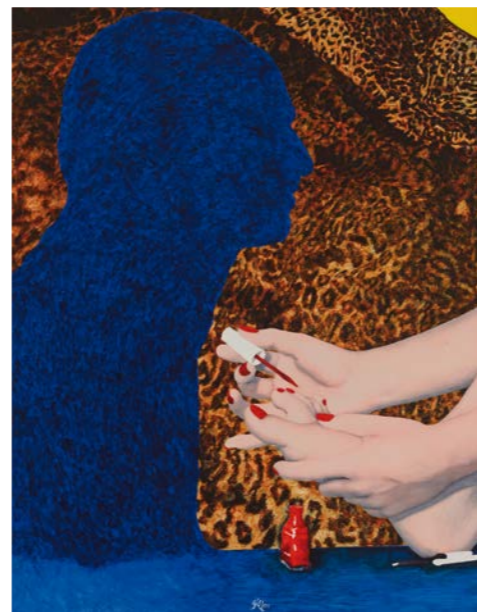
„PAINTING HER TOENAILS“ (2001, Acryl auf Leinwand)