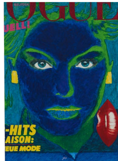
„VOGUE CVR2K-6“ (2001, Acryl auf Leinwand)